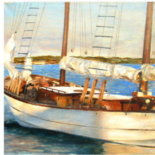
20 ● ADQUIRIDO