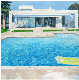
1 ● ADQUIRIDO