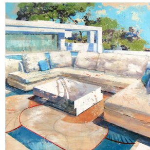
30 ● ADQUIRIDO