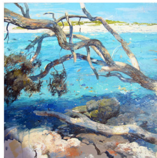
8 ● ADQUIRIDO