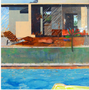
25 ● ADQUIRIDO