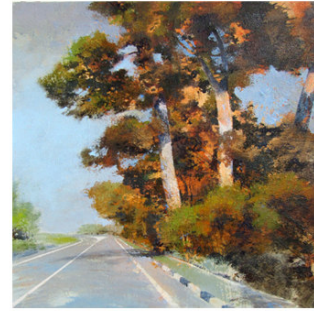
15 ● ADQUIRIDO