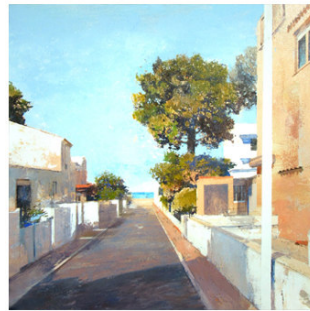
17 ● ADQUIRIDO