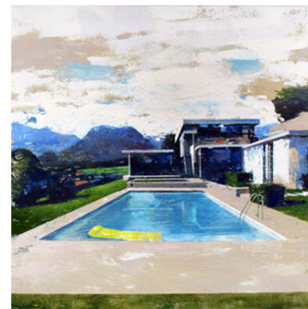
6 ● ADQUIRIDO