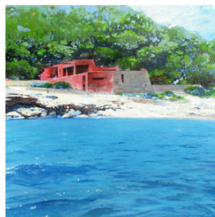
11 ● ADQUIRIDO