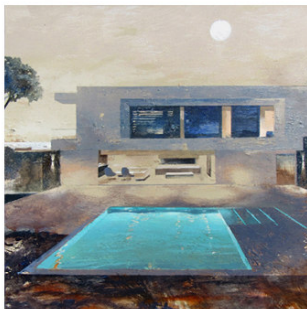
7 ● ADQUIRIDO