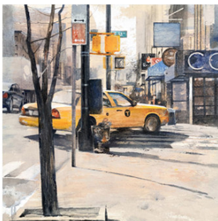
22 ● ADQUIRIDO