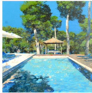
2 ● ADQUIRIDO