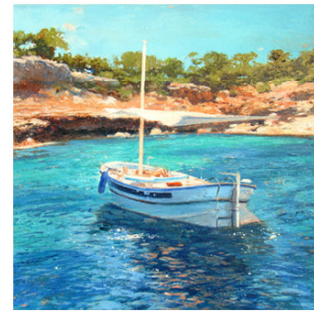
18 ● ADQUIRIDO