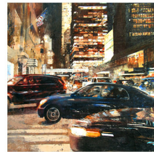
21 ● ADQUIRIDO