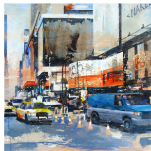
23 ● ADQUIRIDO