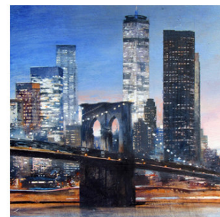
24 ● ADQUIRIDO