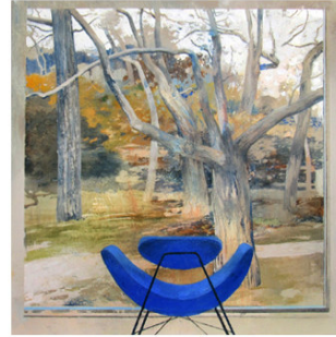
27 ● ADQUIRIDO