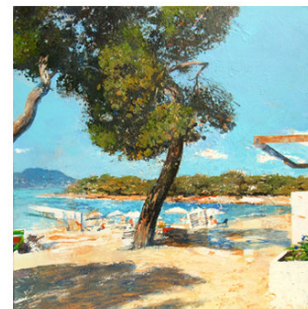
9 ● ADQUIRIDO