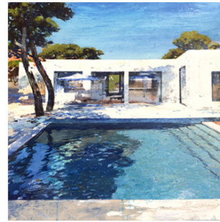
3 ● ADQUIRIDO