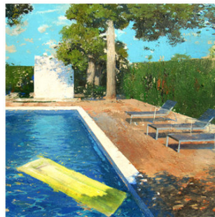
5 ● ADQUIRIDO