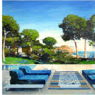
26 ● ADQUIRIDO