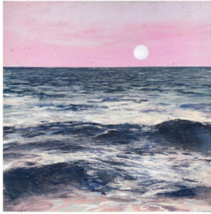
13 ● ADQUIRIDO