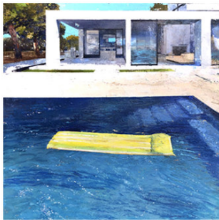
4 ● ADQUIRIDO